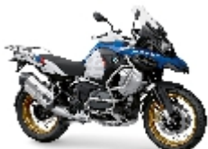
GS 1250 ADV - U$ 1.690,00