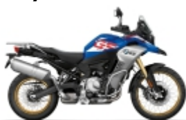
F 850 GS - U$ 1.190,00