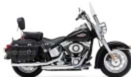
HERITAGE SOFTAIL CLASSIC