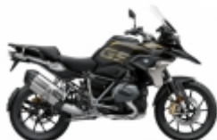
GS 1250 - U$ 1.490,00