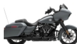
ROAD GLIDE SPECIAL