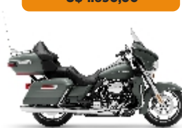
ULTRA GLIDE LIMITED