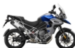
TIGER 1200 - U$ 1.390,00