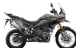
TIGER 900 - U$ 1.090,00