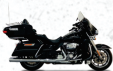
ULTRA GLIDE LIMITED***