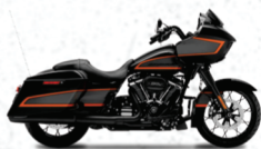
ROAD GLIDE SPECIAL***